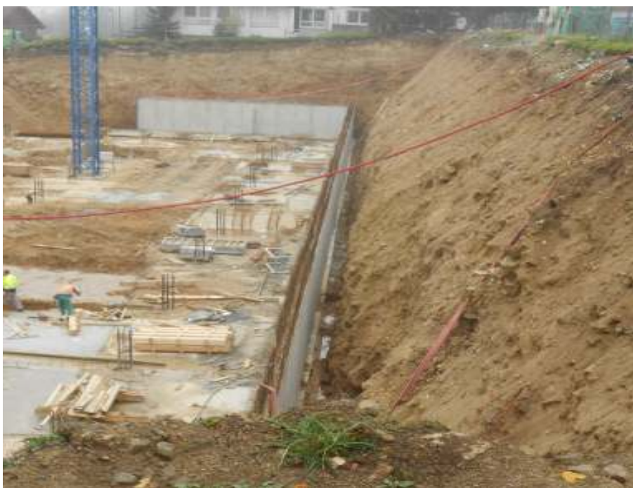
HOTEL S GARÁŽAMI STARÝ SMOKOVEC, PARKOVISKÁ – ZABEZPEČENIE STAV. JAMY