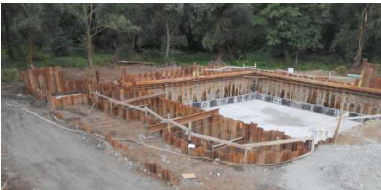
ČOV DRUŽSTEVNÁ PRI HORNÁDE – ZABEZPEČENIE STAV. JAMY