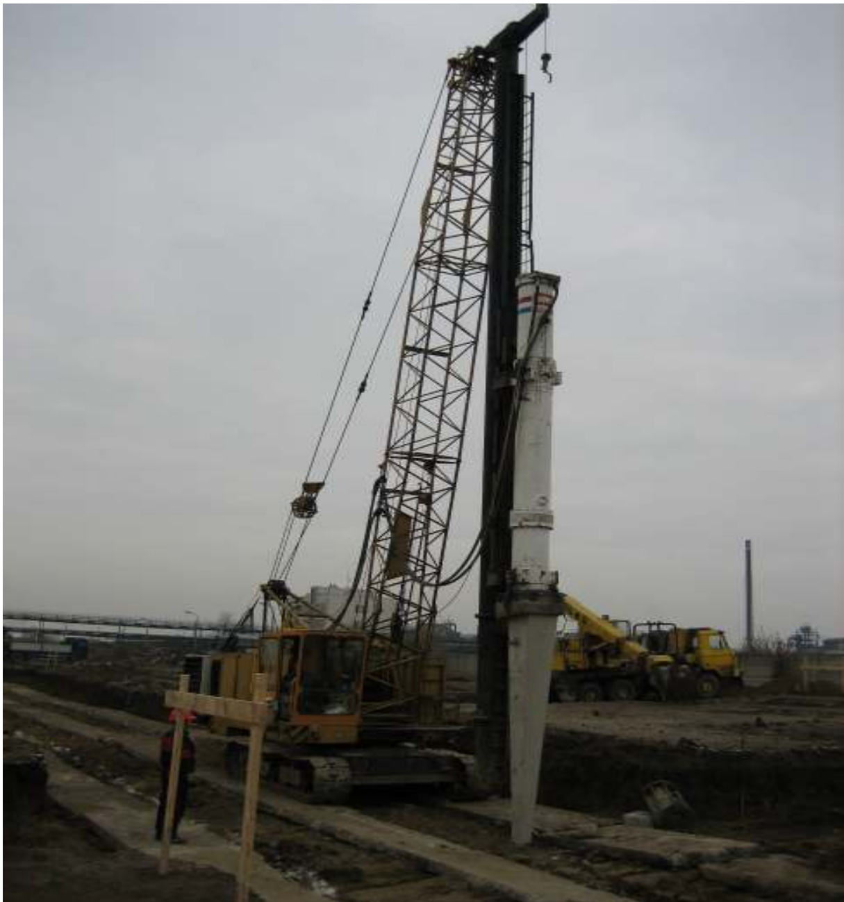
SKLAD HNOJÍV – DUSLO ŠAĽA – ŠPECIÁLNE ZAKLADANIE