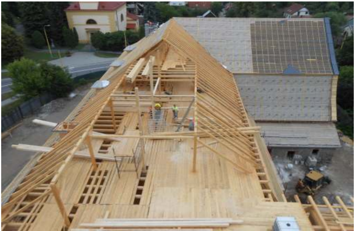
NKP SKLAD SOLI SOLIVAR – OBNOVA KROVU