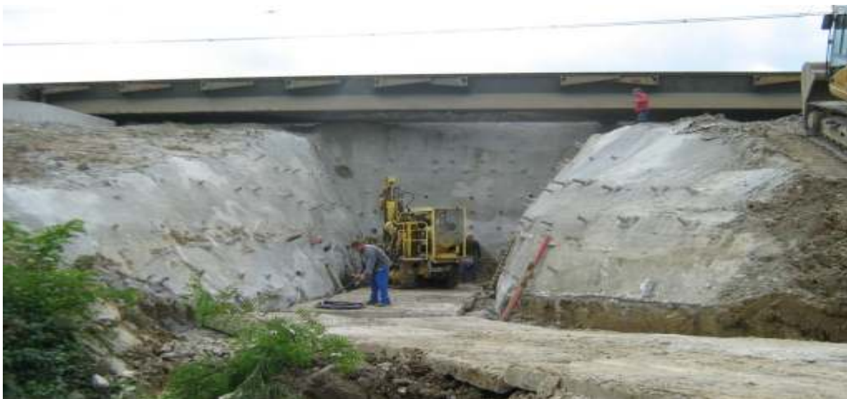
SANÁCIA ZEMNÉHO TELESA, TREBIŠOV-SLIVNÍK V ŽKM 11,9 (EGREŠ)