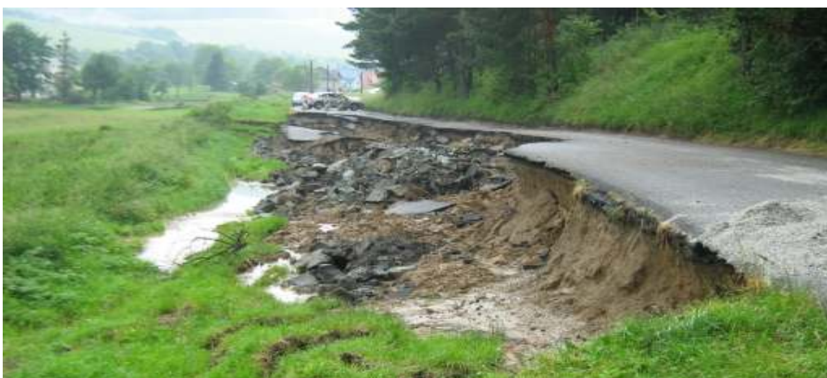
CESTA III/018190 – KRIŽOVANY-HRABKOV