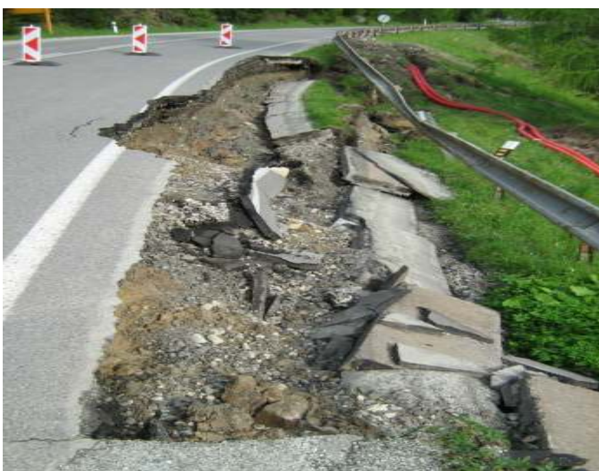
CESTA II/537 - V.HÁGY-ŠTR.PLESO