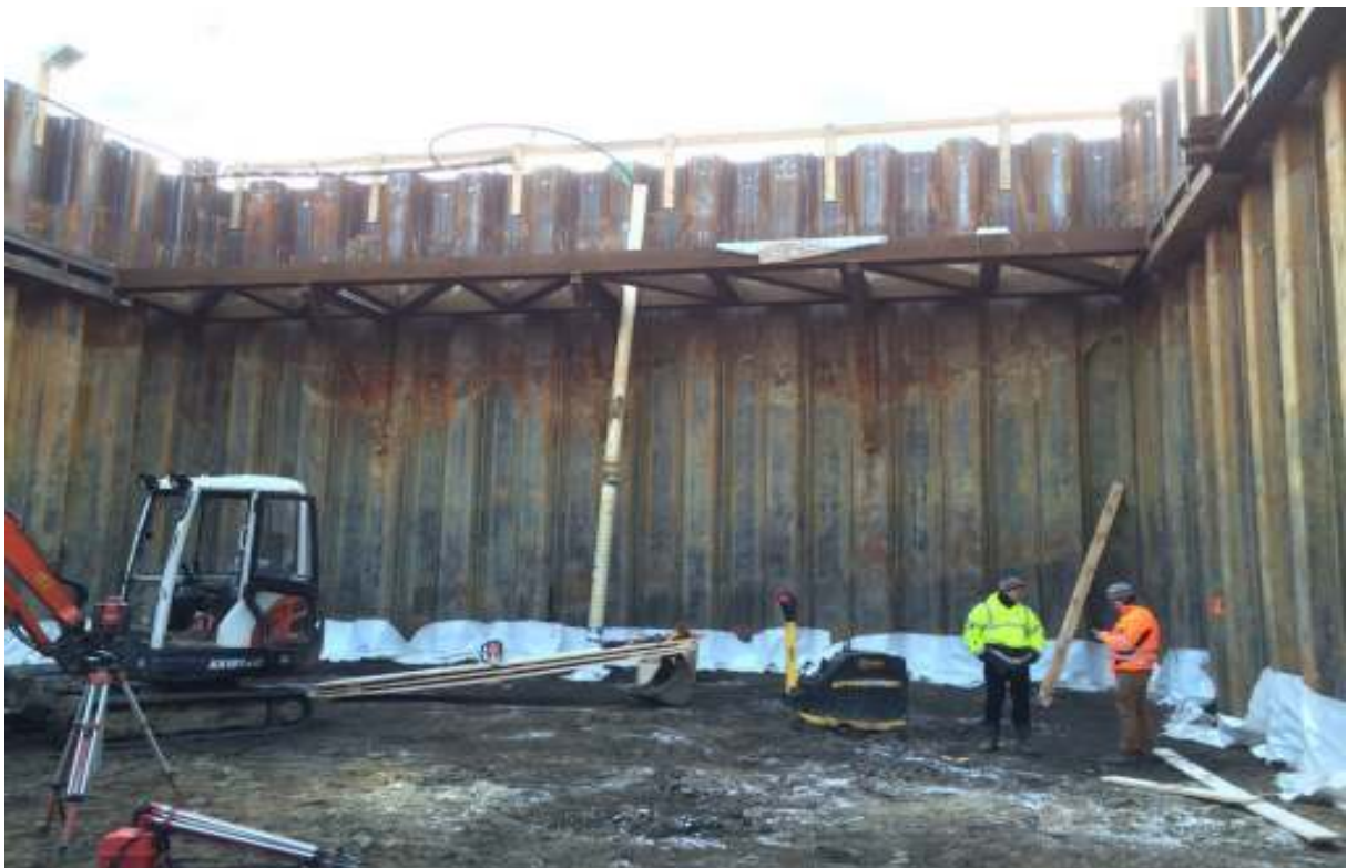
SKYDIVE BERLIN – ZABEZPEČENIE VÝKOPOVEJ JAMY