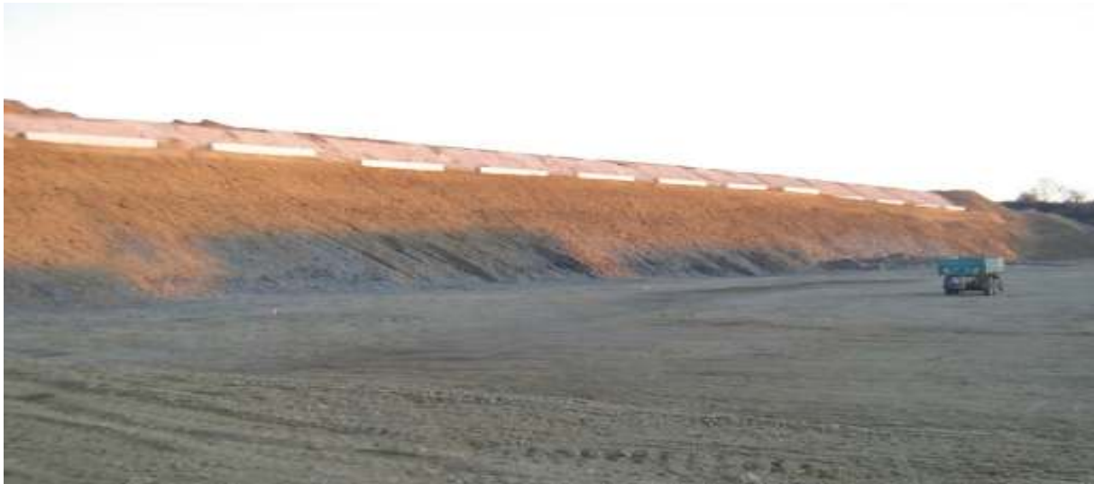
OC KAUF LAND SABINOV, SO-01 HTÚ – ODKOP SVAHU