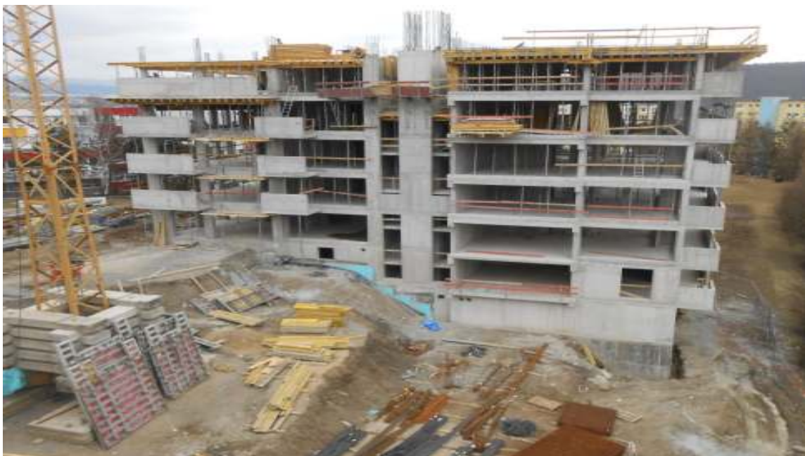
BD MOSKOVSKÁ B.BYSTRICA